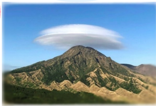
阿蘇高岳にかかった笠雲

4月26日の熊本日日新聞朝刊にて、 阿蘇市波野の箱石峠で撮影された 阿蘇高岳のとても綺麗な笠雲が 載っているのを目にしました。 皆様にも感動をおすそ分けします♪